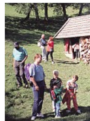
„Outdoor Guide“: mit Diplom

INFO: Informationsabende (jeweils 18 Uhr): 15. 09. im Wifi Wien; 17. 09. im Wifi Salzburg, Lehrgangstart am 7. 11. in Wien, Preis: 1995 Euro. www.wifi.at