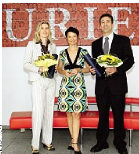
Gewinner: KURIER und Donau-Uni Krems vergeben zwei Stipendien

Für den Mergers and Acquisitions Executive MBA gibt's ein Stipendium in der Höhe von 14.000 Euro von der Technischen Universität Wien in Zusammenarbeit mit der Uni Wien für Absolventen technischer, wirtschaftlicher und juristischer Studienrichtungen an. Infos unter http://merger.tuw